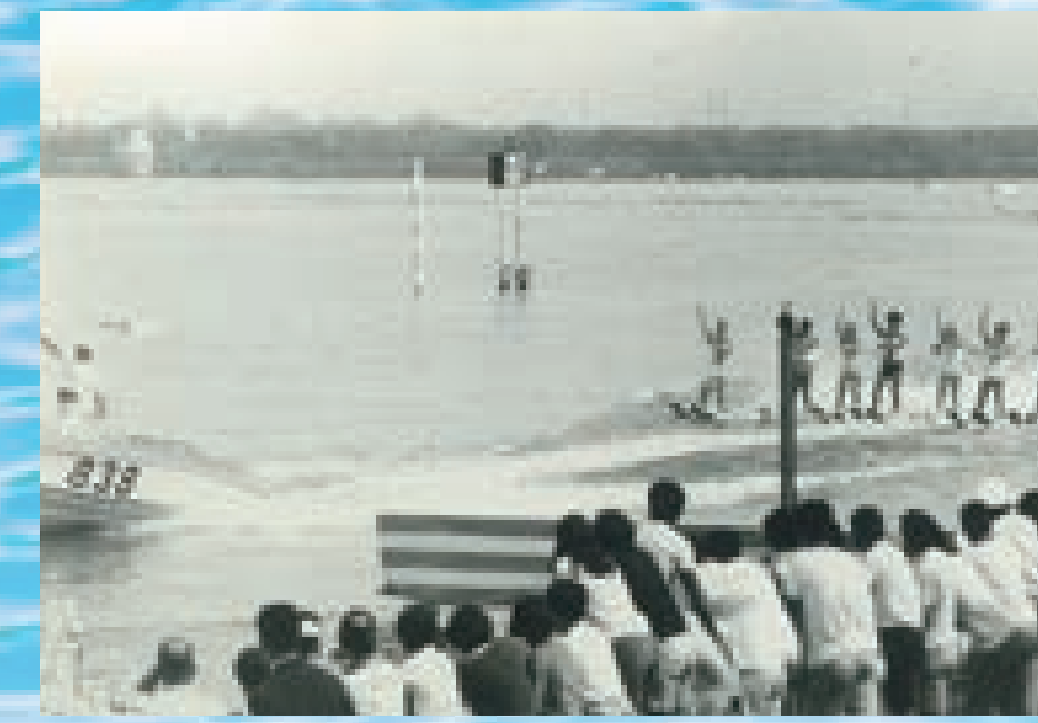
水上スキーのアトラクション