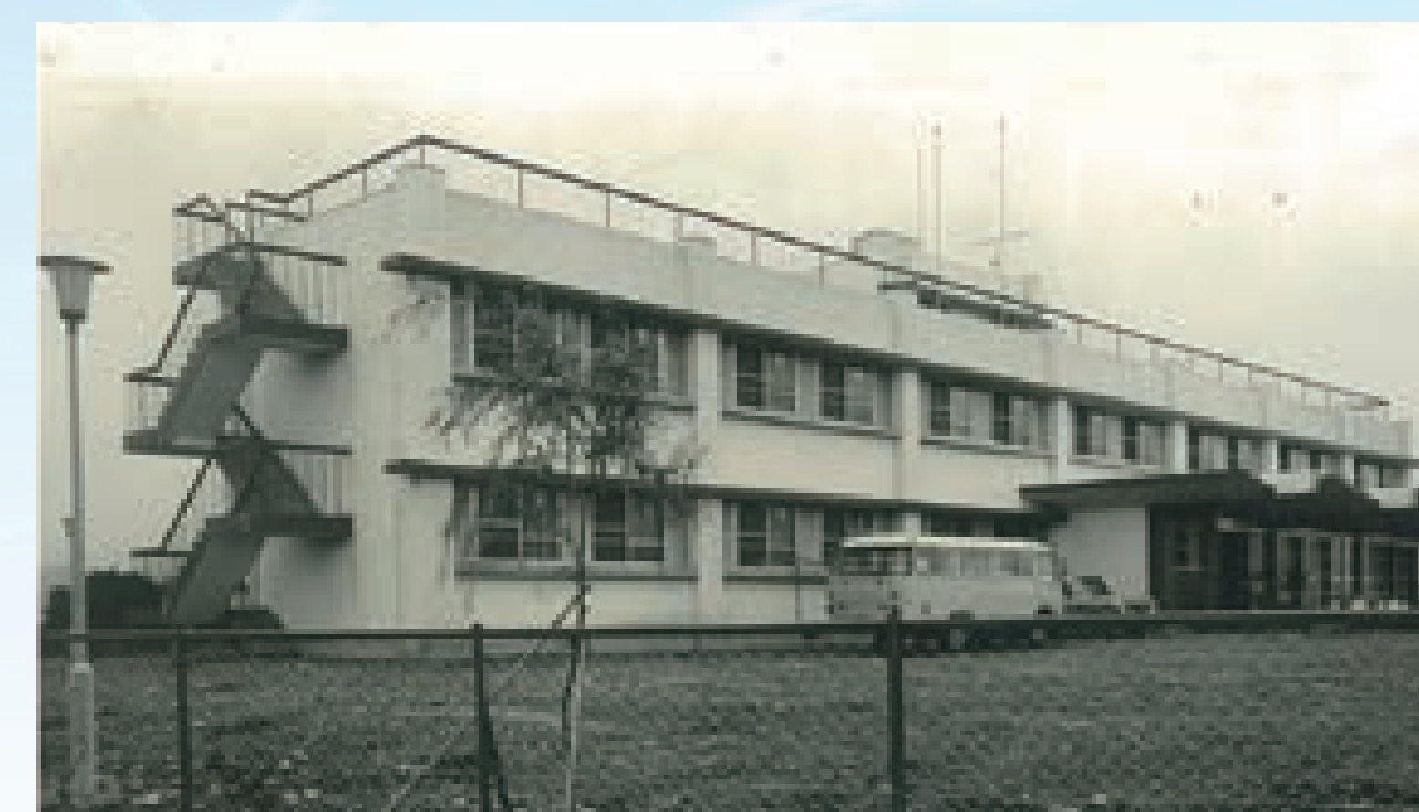
選手宿舎「群競三山寮」完成