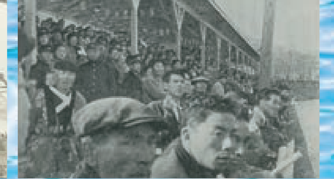
溢れんばかりに押し寄せたファン