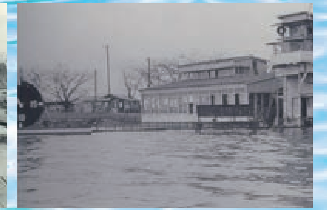
発走信号用時計(大時計)二重針制定、初使用