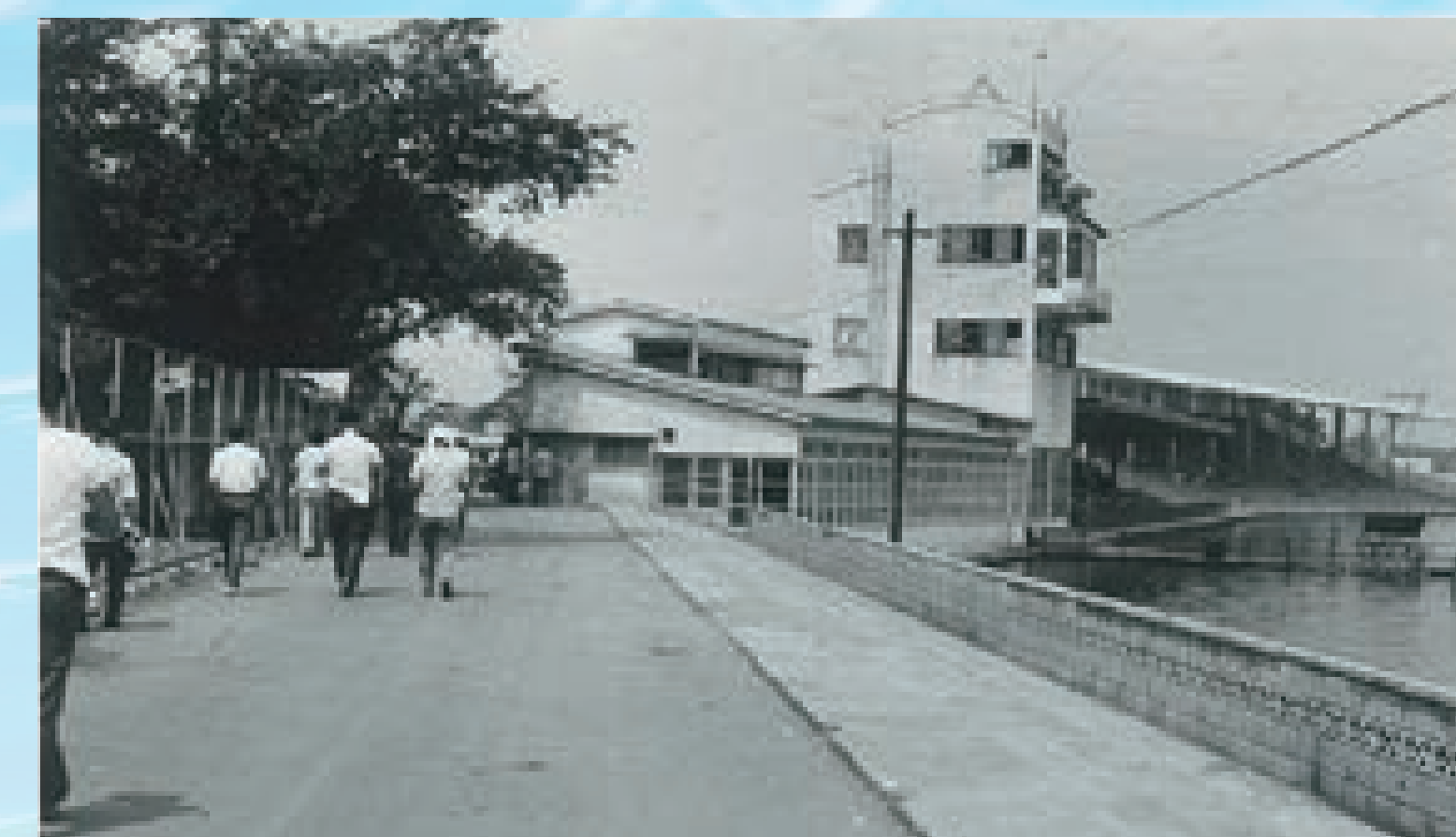
特別観覧席を増築し全国にさきがけ冷暖房設備を設置