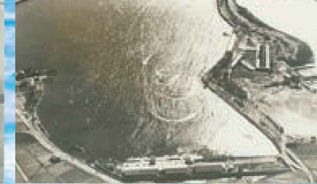
右沼が阿左美遊園地の自然沼