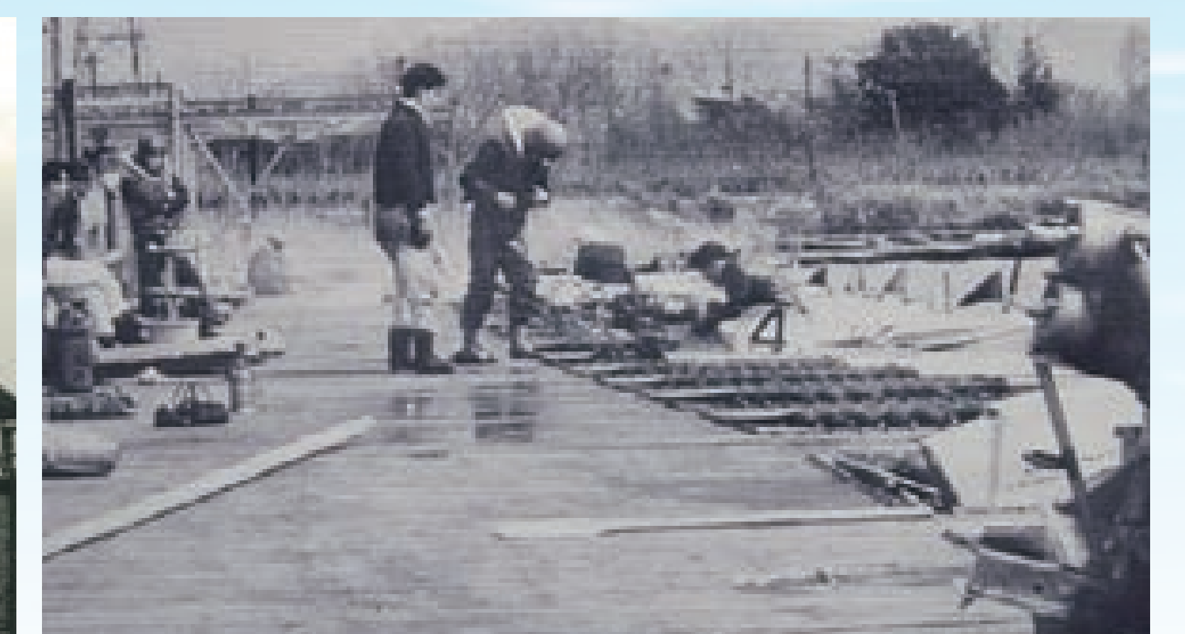
ケーニヒモーターにて全レース競走実施