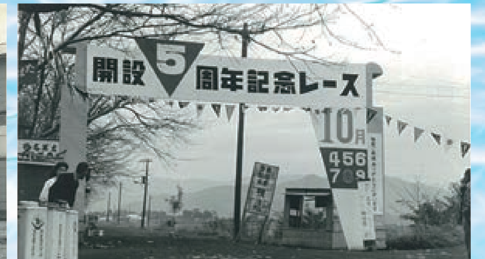
開設5周年記念時 南門