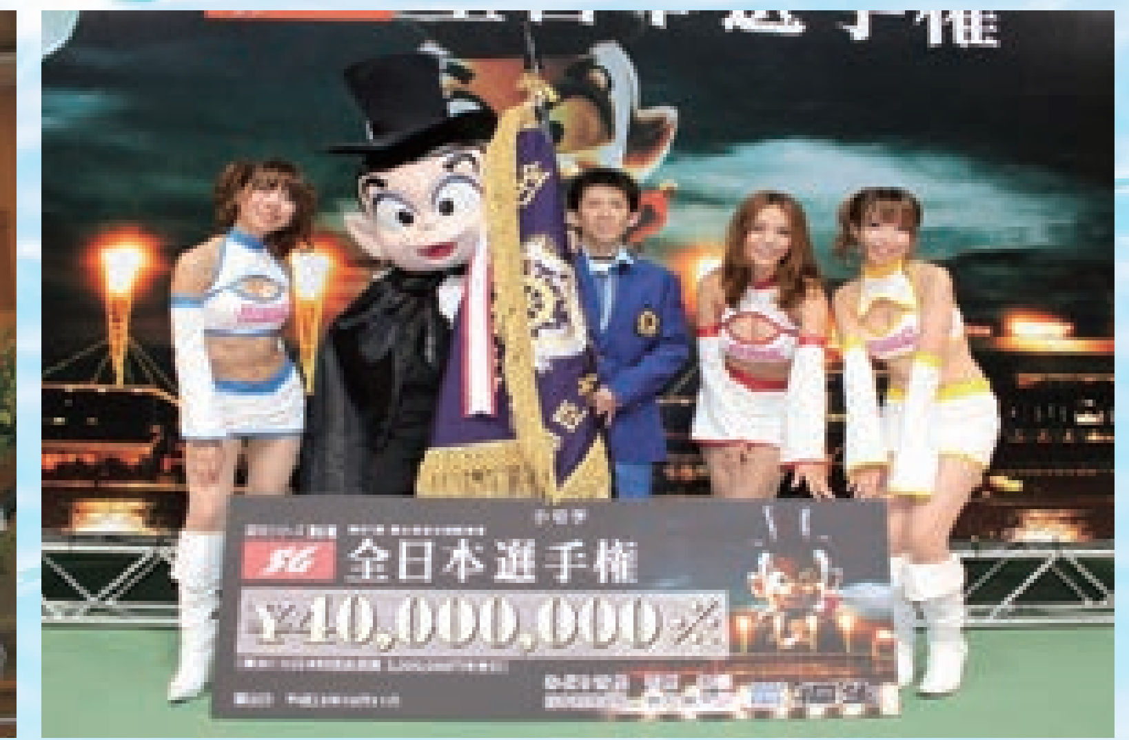
■SG全日本選手権競走をナイター初開催