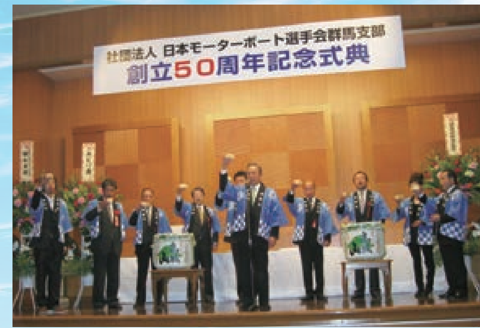
■社団法人日本モーターボート選手会群馬支部 発足50周年記念