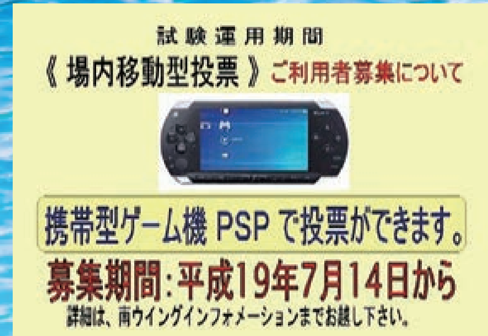
■PSPを使用した移動型投票システムの運用を開始