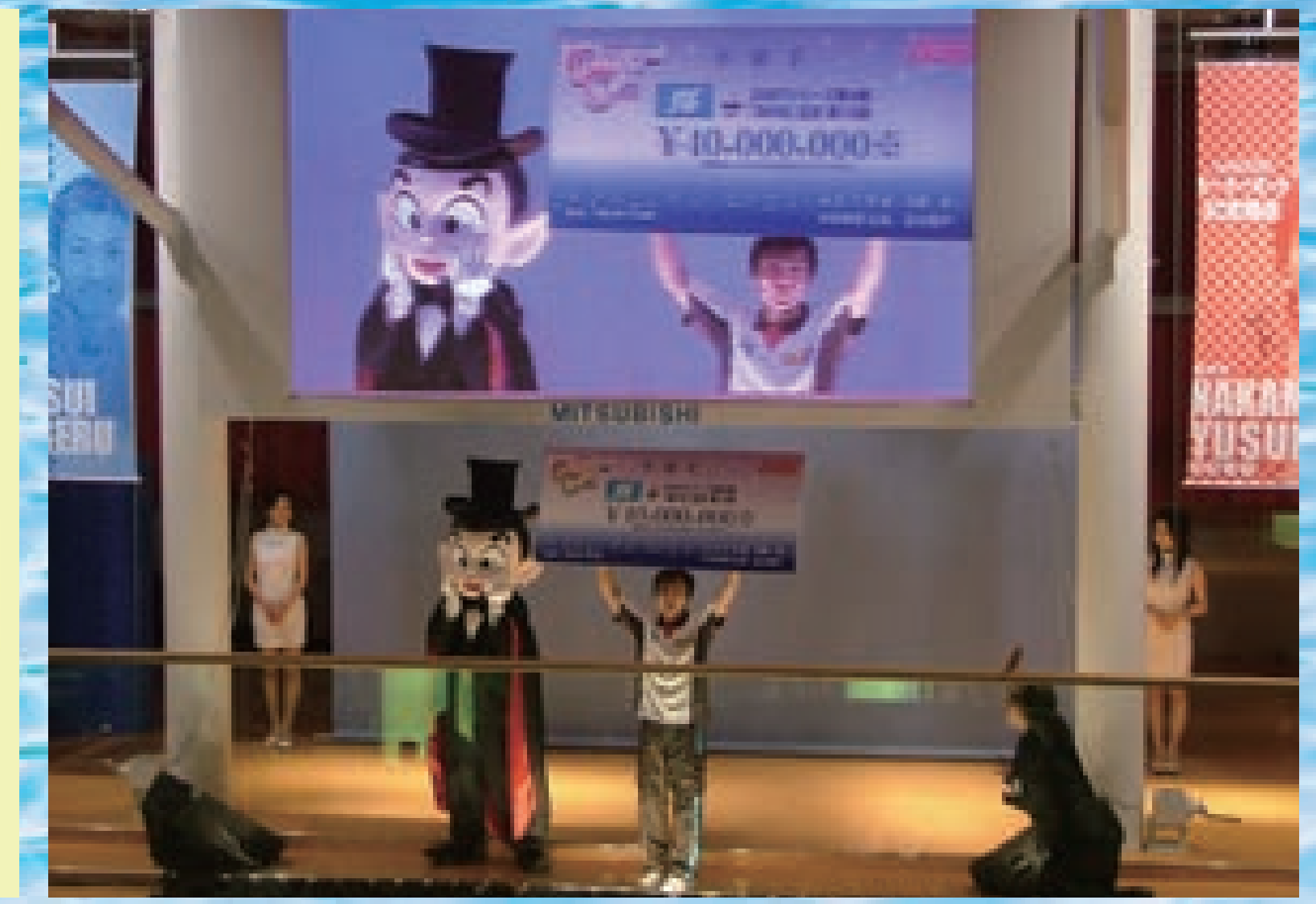
■SG第12回オーシャンカップ競走を開催