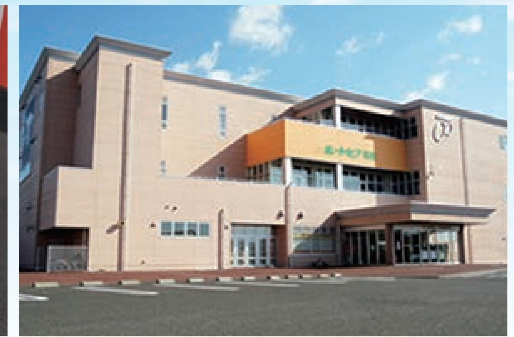
■「ミニポートピア福島」オープン