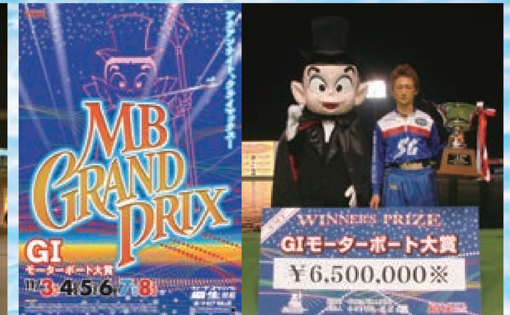
■GIモーターボート大賞競走を開催