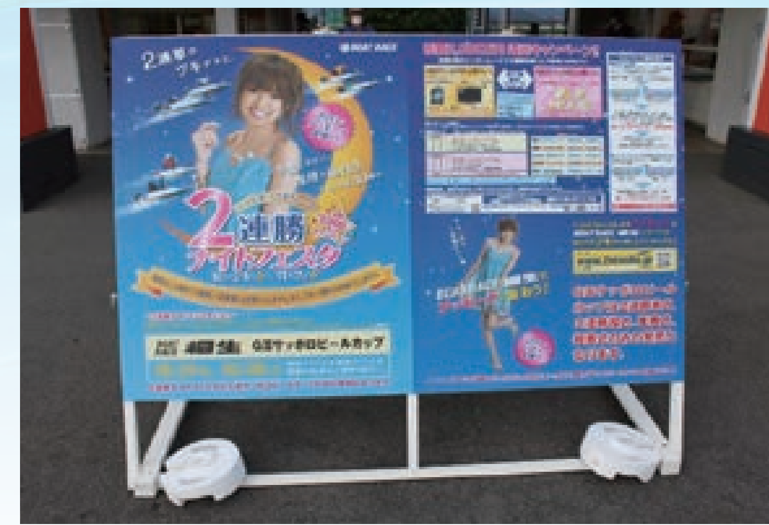
■2連勝ナイトフェスタ実施